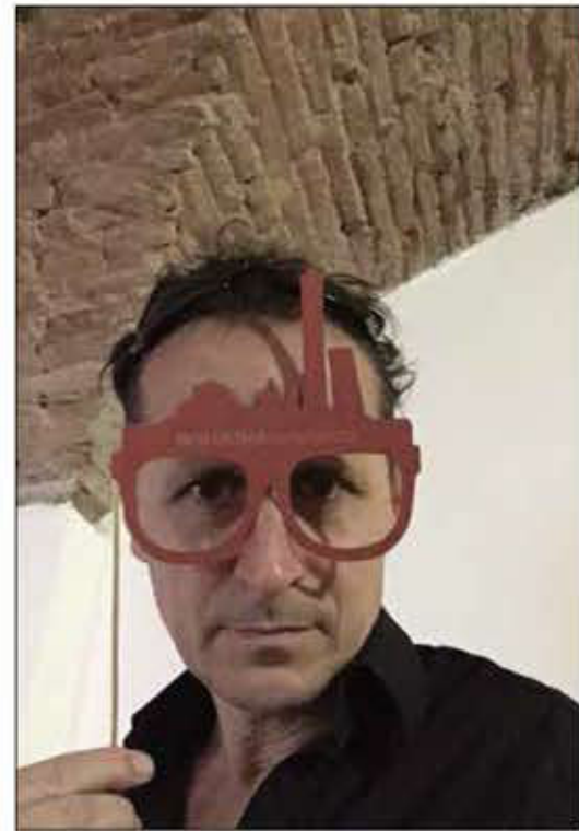
Foto e racconti della Bologna storica in chiave contemporanea.