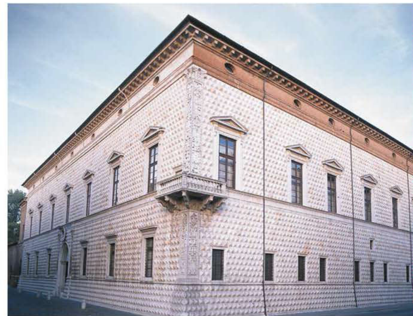
2016, Palazzo dei Diamanti, Ferrara.

«Lampeggia, palazzo spirtal de' diamanti, e tu, fatta ad accôrre sol poeti e duchesse, o porta de' Sacrati, sorridi nel florido arco!»