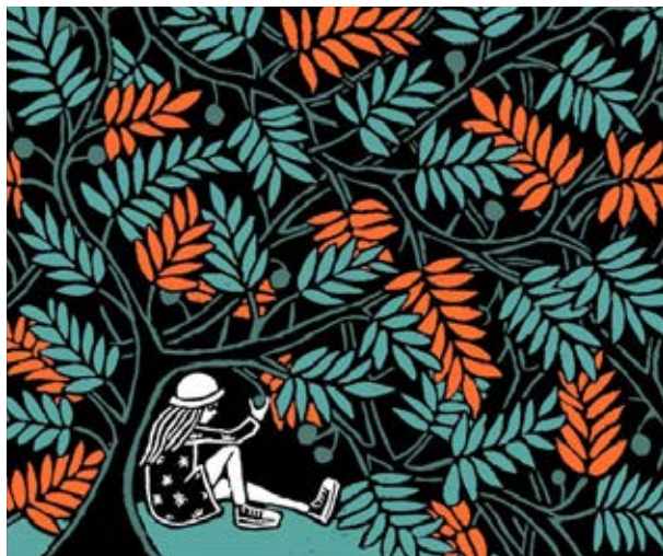
ill. Floor Rieder

“A cosa serve un libro senza figure?” La domanda che Alice porge all’inizio del racconto è legittima e sancisce l’importanza delle figure nella storia della letteratura per l’infanzia. E Alice è una sorta di passaggio obbligato, un’occasione specialissima di confronto per l’illustrazione di tutti i tempi. La mostra, realizzata con la collaborazione della Cooperativa Culturale Giannino Stoppani, propone una selezione delle più pregevoli edizioni del capolavoro di Carroll, rivisitato da grandi illustratori. Dalle prime edizioni illustrate di Tenniel fino ai contemporanei Anthony Browne, Nicole Claveloux, Helen Oxenbury, Lisbeth Zwerger, Alice è un personaggio con il quale molti illustratori si sono cimentati ed ha così via via assunto tante e diverse fisionomie: bambina, ragazzina elegante e raffinata, ma anche più disinvolta monella, Alice è un’icona di una infanzia che sorprende, che non si fa completamente catturare, che abita il paese delle meraviglie, dove anche il pensiero si prende gioco del tutto.