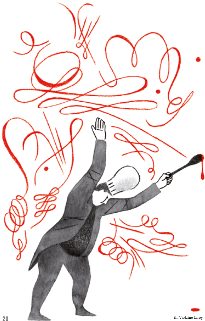
ill. Violaine Leroy