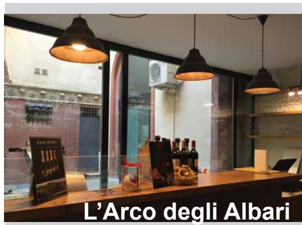
L'Arco degli Albari

Sapori del Sol Levante da Seijo (via Andrea Costa 63/2), elegante ristorante giapponese con la sua