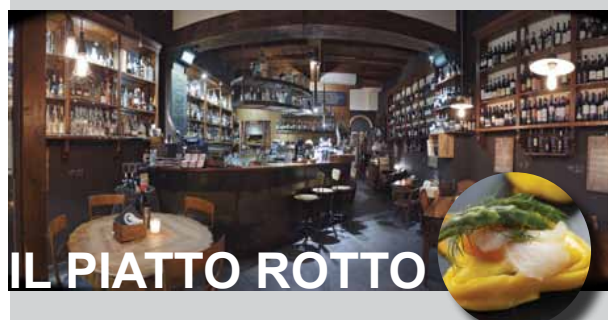
IL PIATTO ROTTO