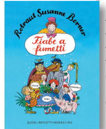
Illustrazione e fumetti per raccontare le classiche fiabe con finali talvolta fuori dal comune.

Un libro interessante di Rotraut Susanne Berner, vincitrice del Premio Andersen nel 2016, autrice tedesca protagonista di un focus durante Fiera Libro per Ragazzi.