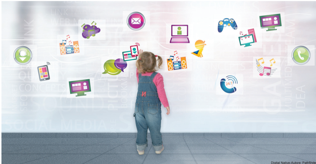
Digital Native-Autore: Pathfinder

L a rete web ci avvolge, ci "osserva" ogni istante in attesa di scambiare e condividere dati, ci racconta un mondo che crediamo "diverso" quando in realtà è solo un'estensione della vita reale (che potremmo definire