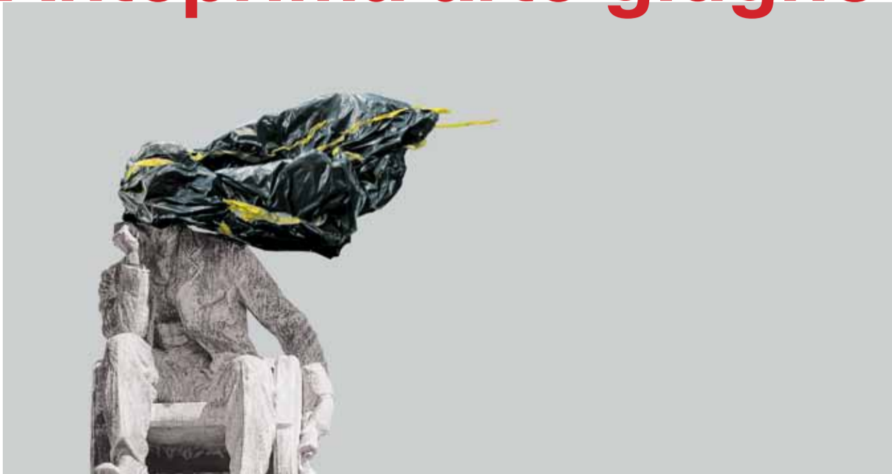
Mahony Collective, Ghosts and the self , 2016. Collage di fotografie provenienti dalla manifestazione di protesta "Rhodes Must Fall" alla University of Cape town, Sud Africa, 2015.