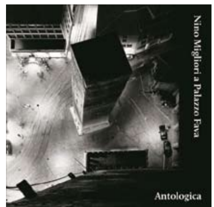
Nino Migliori a Palazzo Fava

l'opera di un artista considerato un vero architetto della visione, trovano ampio spazio all'interno dell'esposizione. Nino Migliori a Palazzo Fava. Antologica è arricchita da una serie di installazioni, per la prima volta a Bologna, collocate in altre sedi di Genus Bononiae: il Museo della Storia di Bologna in Palazzo Pepoli Vecchio ospita Scattate e abbandonate (1978-2012) mentre Casa Saraceni, sede della Fondazione Carisbo, espone Glass-writing. Idrogramma (2004), l'installazione in marmo di Carrara e vetro di Murano donata dallo stesso Migliori alla Fondazione. La mostra, in collaborazione con l'Archivio Nino Migliori, è a cura di Graziano Campanini ed è accompagnata da un catalogo edito da Contrasto. www.genusbononiae.it