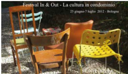
Leggi il programma http://laculturaincondominio.blogspot.it/

Le Culture in Condominio Quando: dall'8 luglio Spettacoli, cinema, teatro, musica e momenti socializzanti, nei cortili e nei giardini di dodici diversi condomini di Bologna. A cura di Teatro dei Mignoli.